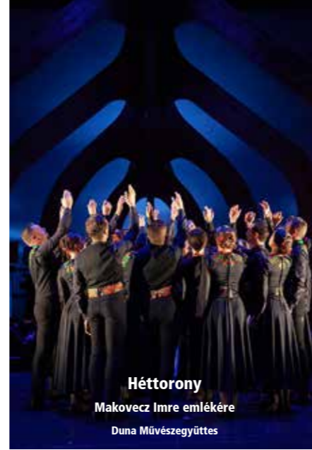
Héttorony Makovecz Imre emlékére Duna Művészegyüttes

Debrecen wordt georganiseerd op de feestdag van de Heilige koning István, 20 augustus. Om deze dag heen is er een feestweek met tal van concerten en toneeluitvoeringen. Het bloemencorso vindt plaats in de ochtend langs de centrumas van de stad. Op diverse plaatsen zijn tribunes ingericht waarvoor plaatskaarten kunnen worden gekocht. Voor deze tribunes worden telkens