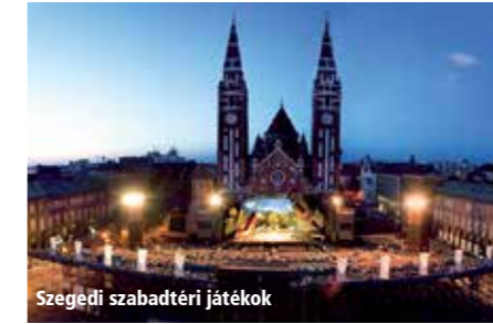
Szegedi szabadtéri játékok

Szegedi szabadtéri játékok , Szeged Met o.a. Omega Emlékkoncert , Kispál és a Lovasi , Egy csók és más semmi , 'Zenére fel' (zigeunermuziek- en volksdansvoorstelling e.a.) https://www.szegediszabadtteri.hu