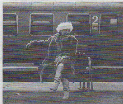
Op 16mm uitgebracht door het Nederlands Filminstituut

Een aangrijpend documentair drama, resultaat van de eerste co-productie op filmgebied tussen Nederland en Hongarije.