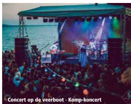
Concert op de veerboot · Komp-koncert

karnak, amikor nem szerepbe bújnak, hanem természetesen viselkednek, tehát amikor egyszerűen, mindenféle instrukció nélkül csak zenélhetnek és önfeleltül jól érezhetik magukat. Nemhiába, ez erős szimpátiát vált ki az emberekből, olyannyira, hogy még a máltai Sliemában egy éttermet is elneveztek a Margaret Islandról. A megnyitón fel is léptek. A környező országokba is rendszeresen visszajárnak fellépni. Mindez jól bizonyítja, hogy a zene mindenkié, határok nélküli, bárholva el lehet jutni.